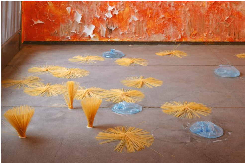
© Adagp - photo: André Morin

Exposition du 12 janvier au 26 février à la médiathèque de Nègrepelisse