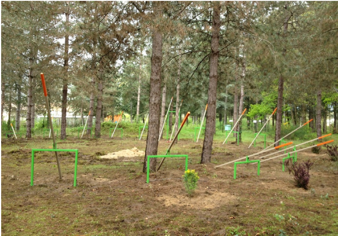
matali crasset, Le bois de sharewood, 2012, installation dans le bois de Montrosiès à Nègrepelisse. Vue de la première phase d'implantation du projet, avril 2012.

La cuisine, centre d'art et de design / bureaux : 3 place du monument aux morts - 82 800 Nègrepelisse 05 63 67 39 74 / info@la-cuisine.fr / www.la-cuisine.fr Contact presse : Karine Marchand / karine.marchand@la-cuisine.fr