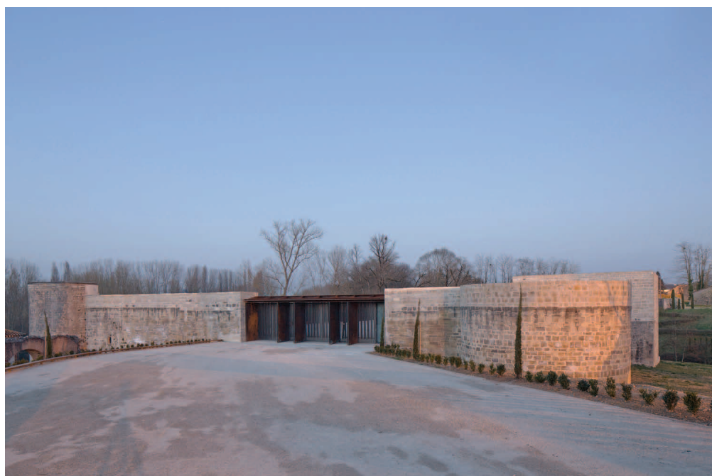
La cuisine, centre d'art et de design, au château de Nègrepelisse, 2014. Architecture : RCR.

Il aura à cœur de continuer à faire de La cuisine un lieu vivant, ouvert sur la création contemporaine, un laboratoire exigeant des pratiques artistiques, engagé dans un dialogue fécond avec son territoire et sa population.